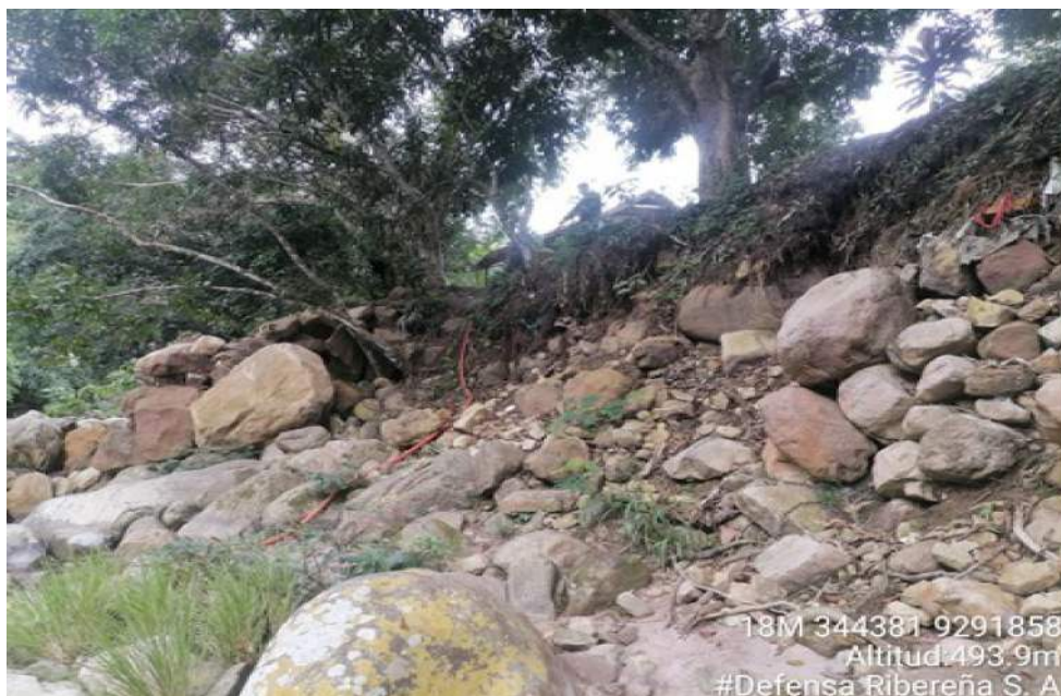
FOTOGRAFIA N°01: DESCOLMATAACION DEL CAUCE Y RIBERA DEL RIO CUMBAZA