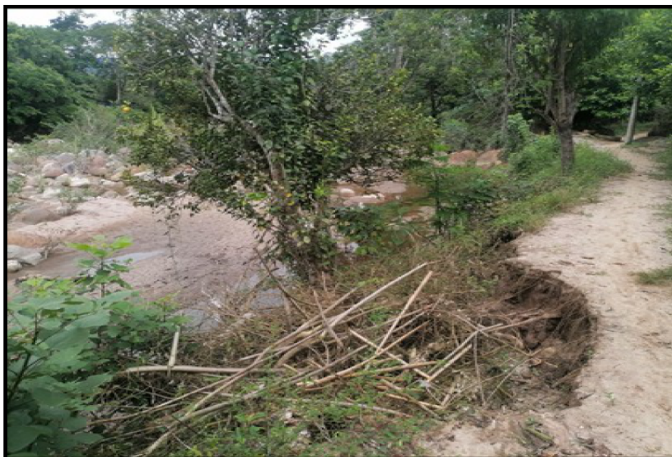
FOTOGRAFIA N°02: EROSIÓN DE LA RIBERA EN MARGEN IZQUIERDA